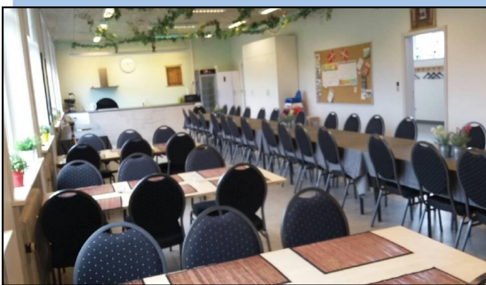
Borde og stole må omrokeres, - og stilles på plads igen..

- Beklager farve- og billedekvalitet, - meningen er go' nok.. :-)