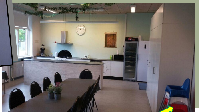
- 3 Højstole til de mindste ..

Klubbens lokaler efterlades i samme stand som ved modtagelse.. TAK! :-)